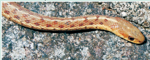
Mince avec trois bandes jaunes