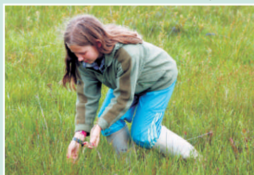
À la recherche de la couleuvre mince